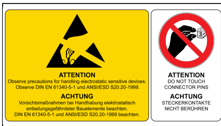
4 - ESD Hinweise / ESD Notes