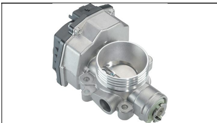
1 - Produkt / Product