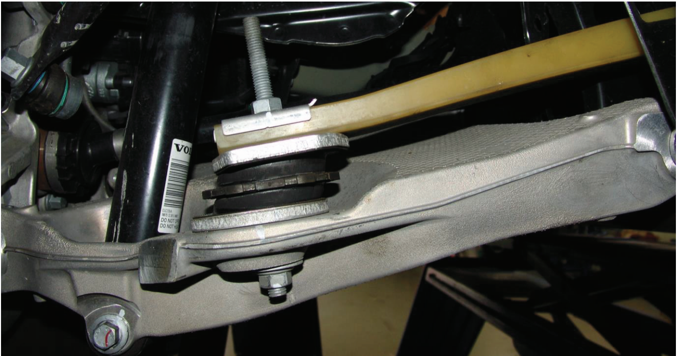
illustration 2: removing the spring pad left and right