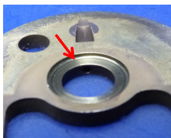
Durch Axialschub eingelaufenes Axiallager

Prüfleitung vor DPF am Differenzdrucksensor mit T-Stück, Schlauchleitung und Manometer abgreifen. Bei Betriebstemperatur des Fahrzeuges darf während einer Probefahrt bei Leistungsanforderung der gemessene Abgasgegendruck in keinem Drehzahlbereich 300 mbar erreichen. Beachten Sie zum Thema Druckverhältnisse am Turbolader unbedingt die Beiträge in unserem Technikratgeber Band 4. Wir bieten über Ihren Händler ein geeignetes Equipment Art.: MESS01 an