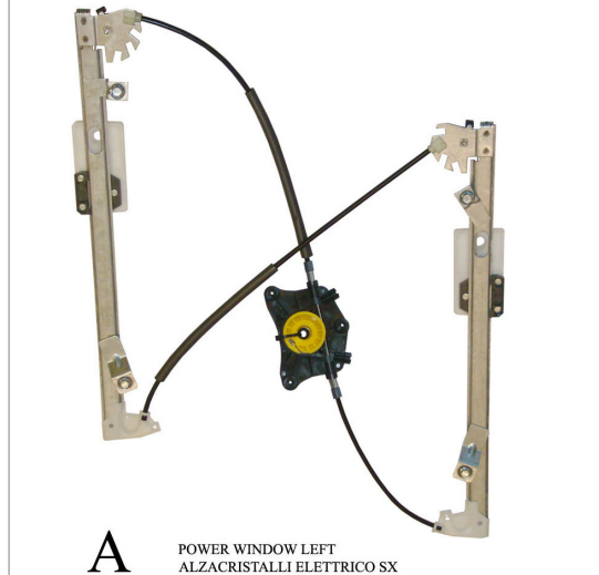
A POWER WINDOW LEFT ALZACRISTALLI ELETTRICO SX

THIS INSTALLATION INSTRUCTION IS FOR BOTH LEFT AND RIGHT SIDE. CETTE INSTRUCTION DE MONTAGE EST POUR LES DEUX COTES DROIT ET GAUCHE. DIESE MONTAGE-ANLEITUNG IST FÜR DIE BEIDE LINKE UND RECHTE SEITE. ESTA INSTRUCCION DE MONTAJE ES PARA LOS DOS LADOS IZQUIERDO Y DERECHO. ESTAS INSTRUÇÕES VALEM TANTO PARA O LADO ESQUERDO QUANTO PARA O DIREITO. LA PRESENTE ISTRUZIONE VALE SIA PER IL LATO SINISTRO CHE PER IL LATO DESTRO.